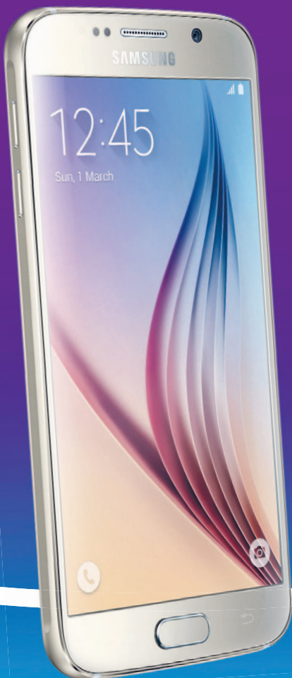
SAMSUNG Galaxy S6