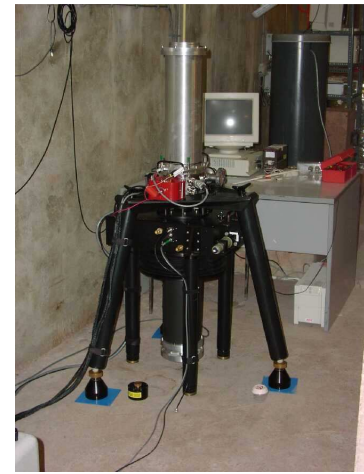
Figuur 3 : De absolute gravimeter FG5#202 bepaalt de valversnelling te Membach met een nauwkeurigheid van 10^{-9} g. In functie van de seizoenen en na correctie van gekende variabele effecten zoals de getijden varieert de waarde van g er van 9,810 467 20 tot 9,810 470 30 m/s 2 . Er zijn momenteel slechts een dertigtal zulke instrumenten in de wereld aan het werk.