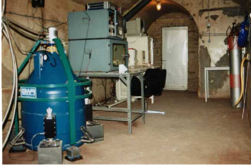
Figuur 4 : De supergeleidende gravimeter GWR#C021 meet continu de variaties van de valversnelling te Membach met een nauwkeurigheid van 10^{-10} g. Het is een van de twintig gravimeters van dit type ter wereld.