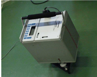
Figuur 2 : De veer-gravimeter Scintrex CG3M is een van de instrumenten die Sterrenwacht gebruikt op het terrein. Dit toestel meet de variaties van de zwaartekracht met een nauwkeurigheid van 10^{-8} g.